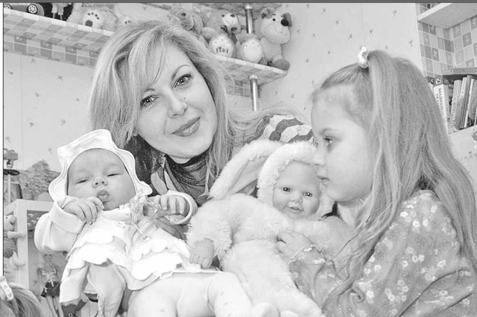
Ольга — идеальная мама: успевает и работать, и заниматься дочками

— Нет. Пока мы как-то не говорили об этом. Хотя однажды был такой момент. Мы работали на стройке своего дома. В тот день переоделись в рабочую одежду, заляпались цементом. И тогда любимый предложил мне в таком виде пойти в рагс. Мы похихикали, но на этом все и закончилось. Нас совершенно устраивают такие отношения, как сейчас. Считаю, что штамп абсолютно ничего не дает. Я Водолей, а это очень свободолюбивый знак. И мне кажется, что, когда будет штамп, начну быть кому-то чем-то обязанной, а я не хочу этого. Стремлюсь в жизни все делать с удовольствием, чтобы меня ничего не напрягало. И точно так же думает мой любимый, у нас в семье нет такого: «Постирай мне, пожалуйста!»