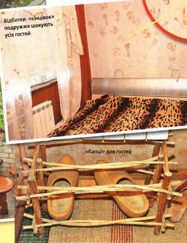
«Капці» для гостей