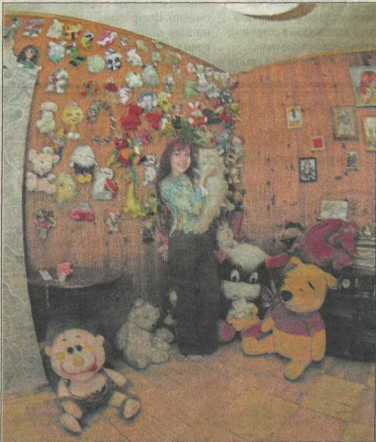
«ДЕТСКАЯ» ЖДЕТ МАЛЫША